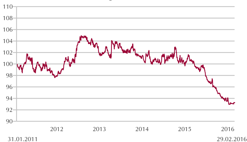
Wertentwicklung seit Auflage (in Fondswährung = Euro, auf 100 indexiert)